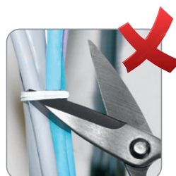
Con las tijeras se dañan los cables.